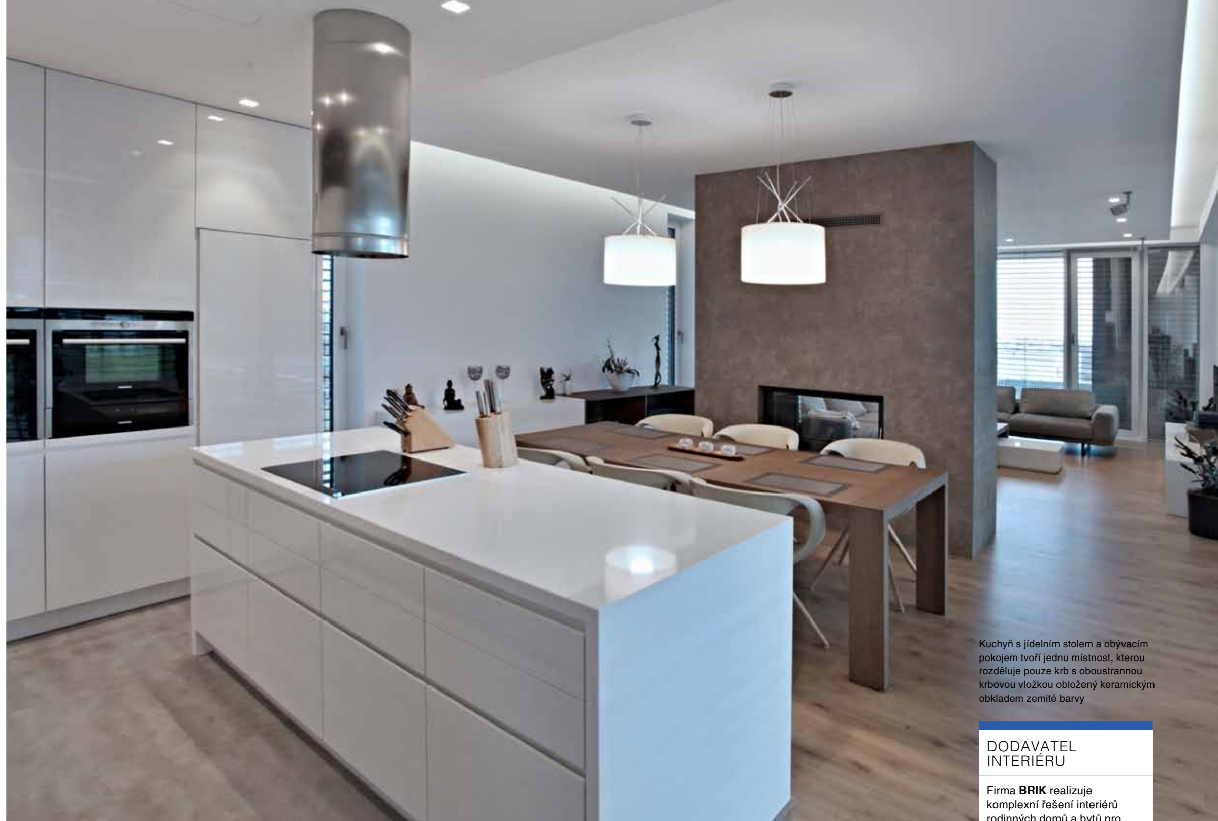
Kuchyň s jídelním stolem a obývacím pokojem tvoří jednu místnost, kterou rozděluje pouze krb s oboustrannou krbovou vložkou obložený keramickým obkladem zemité barvy