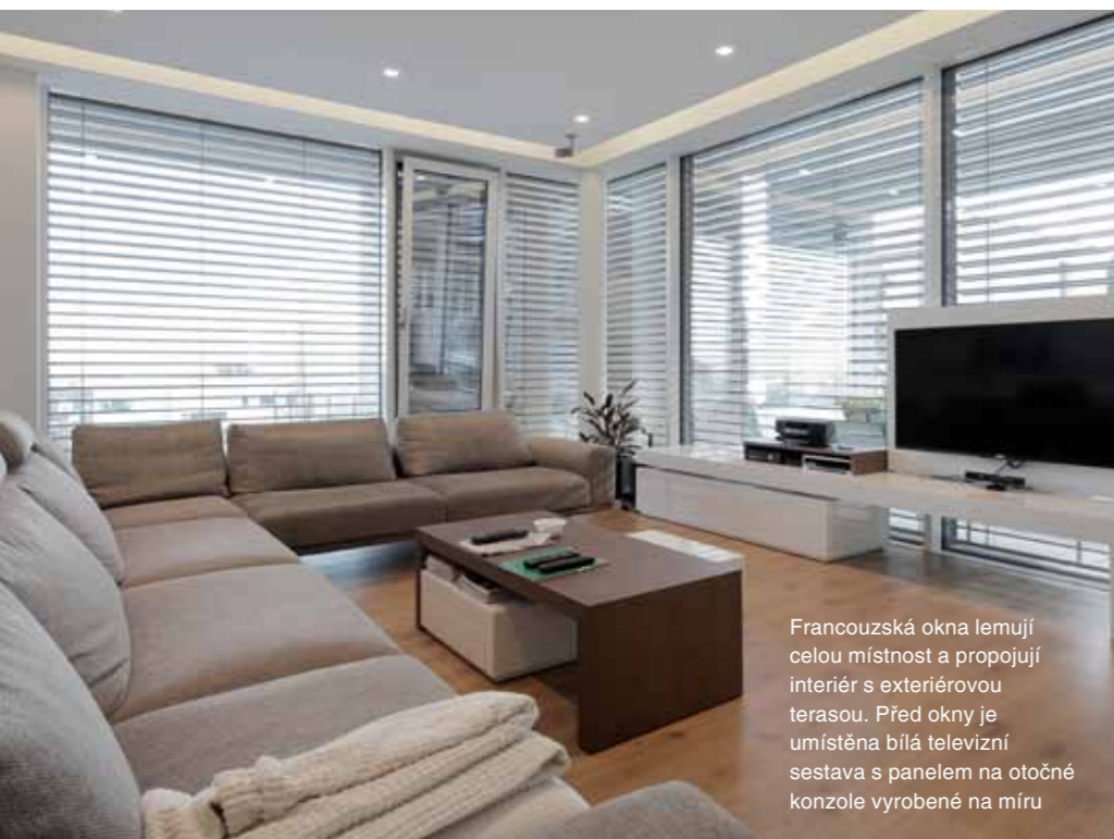
Francouzská okna lemují celou místnost a propojují interiér s exteriérovou terasou. Před okny je umístěna bílá televizní sestava s panelem na otočné konzole vyrobené na míru

Celý interiér byl navržen a vyroben na míru. Během realizace probíhaly konzultace mezi architektem a realizátorem firmy Brik, aby se maximálně doladil každý detail