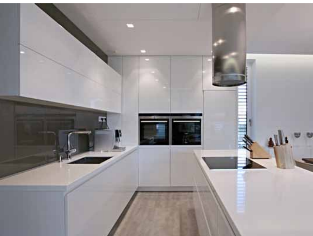
▲ Bílou kuchyň ve vysokém lesku doplňuje pracovní deska z umělého kamene Zodiaq®. Dostupnost vnitřního vybavení je řešena bez použití vystupujících úchytek, kování dodala firma Blum. Zadní plocha obkladu ze skla je opatřena stejnou barvou, jako obklad krbu. V obkladu jsou zapracované „neviditelné“ dveře do spíže